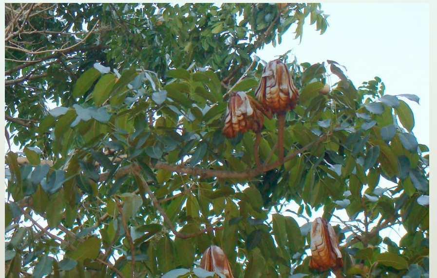
Blick in die Krone eines Mahagonibaumes ( Swietenia macrophylla )

Treffpunkt zur Führung 10:00 Uhr Haupteingang zum ÖBG