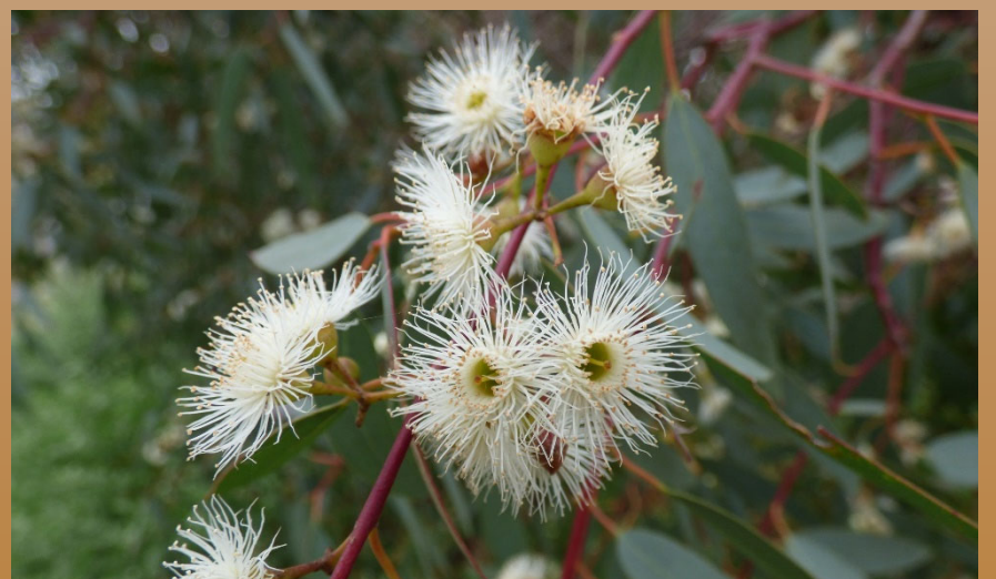
Blüten von Eucalyptus camaldulensis . Diese Art wird häufig in Plantagen angebaut.