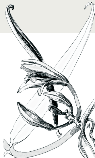
Vanilla odorata Blüte einer Vanille-Pflanze

Tel. 0921/552961 E-mail: obg@uni-bayreuth.de www.facebook.com/obgBayreuth www.obg.uni-bayreuth.de