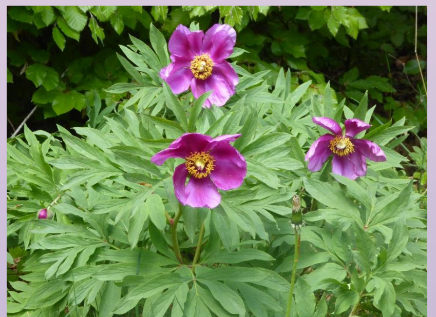
Paeonia officinalis . Pfingstrosen haben regionale Bedeutung als Schnittstaude