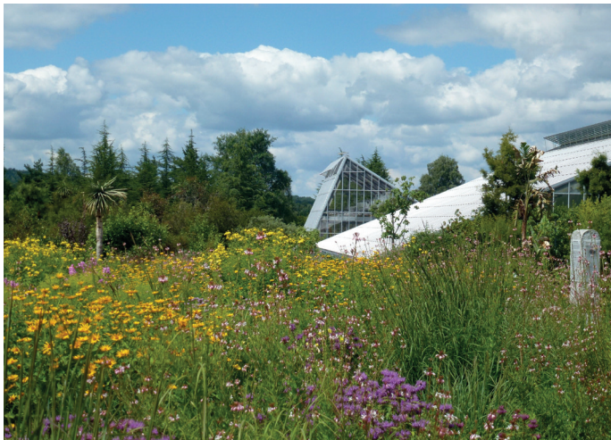
Vue sur les serres de l'ÖBG au-dessus de la prairie d'Amérique du Nord.