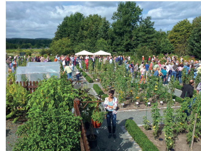
Visitantes en el jardín de la sección de plantas de cultivo

En seis invernaderos con diferentes condiciones climáticas, la travesía botánica nos lleva por tierras bajas y húmedas, las junglas y manglares de las Islas Canarias y los bosques secos de Sur América y África. Visita la exposición interior de vegetación alpina tropical y la colección extendida de plantas mediterráneas y subtropicales que también están disponibles al aire libre durante el verano. A lo largo de todas las exhibiciones tropicales y subtropicales, damos especial atención a plantas de cultivo de gran importancia como la papaia, el algodón y el cacao, además introducimos otras no tan populares como el lulo y la lúcuma.