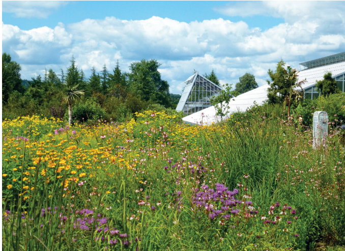
Blick über die Nordamerikanische Prärie auf die Gewächshäuser.

Der Ökologisch-Botanische Garten (ÖBG) bietet eine einzigartige botanische Reise um die ganze Welt in nur wenigen Stunden! Über 10.000 Pflanzenarten können Sie hier in naturnah gestalteten Lebensräumen auf 16 ha Freigelände und in den 3000 m 2 großen Schaugewächshäusern erleben.