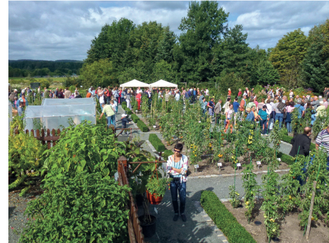
Besucher im Nutzpflanzengarten bei einem Aktionstag.

In den sechs unterschiedlich klimatisierten Schaugewächshäusern führt die botanische Reise durch feucht-warme Tieflandregenwälder und Mangroven, in die Lorbeerwälder der Kanaren und durch die Trockenwälder Südamerikas und Afrikas. Besonderheiten sind das Haus für Pflanzen tropischer Hochgebirge und die mehrere tausend Individuen mediterraner und subtropischer Pflanzen, die im Sommer ihren Platz im Freien haben. Neben der Darstellung der tropischen Lebensräume gilt ein Augenmerk weltwirtschaftlich wichtigen tropischen Nutzpflanzen wie Papaya, Baumwolle und Kakao sowie weniger bekannten wie Lulo und Lucuma.