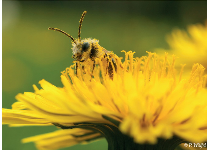
Eine der über 170 Wildbienenarten, die im ÖBG vorkommen.

Auf über 2 ha Fläche werden alljährlich etwa 800 Arten und Sorten alter und neuer Gemüse, Getreide, Faser- und Färbepflanzen und viele weitere Nutzpflanzen kultiviert. Wechselnd wird aus diesem Sortiment eine Gruppe von Nutzpflanzen als Schwerpunkt präsentiert. Dem Erhalt alter und regionaler Obstsorten dient eine ausgedehnte Streuobstwiese mit mehr als 130 verschiedenen Sorten. Im Heilpflanzengarten finden sich, nach Indikationen angeordnet, über 60 Heilpflanzen, von denen viele als Hausmittel bekannt sind.